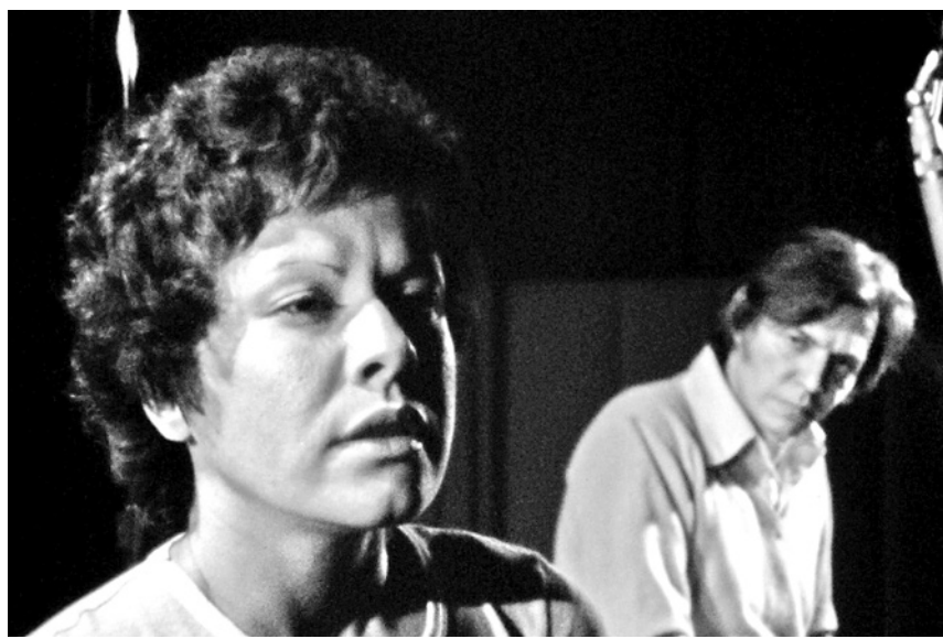
Cena do documentário em longa-metragem 'Elis &amp; Tom, Só Tinha de Ser com Você'

Mas não é disso que majoritariamente o filme de Roberto de Oliveira (com roteiro dele e de Nelson Motta) é feito, e sim dos momentos de tranquilidade e ensaios que Elis, Tom e César passaram naquela temporada, após encerrado o mal estar inicial. As imagens de época mostram muita conversa, descontração (Tom até conta uma piada!) e