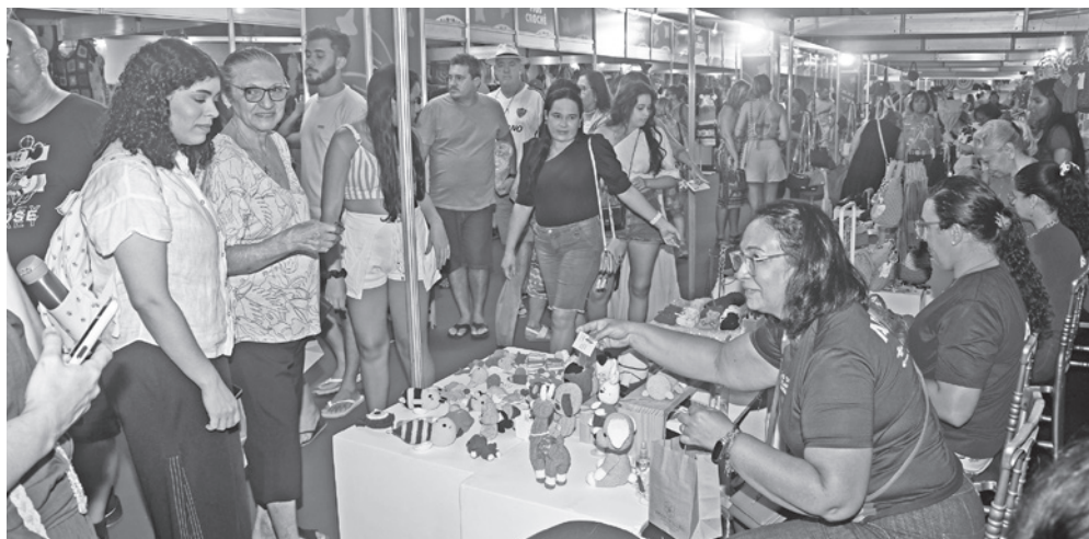
Até domingo, foram vendidas 10.146 peças em toda a feira; movimento é celebrado por artesãos

peças que vêm até aqui é porque gostam e valorizam o artesanato, e isso contribui muito”, comentou a artesã ao revelar que já vendeu mais de R$ 700 em peças de artesanato.