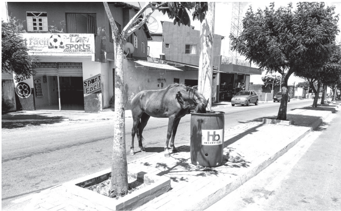
Abandono que leva ao lixo por causa da fome