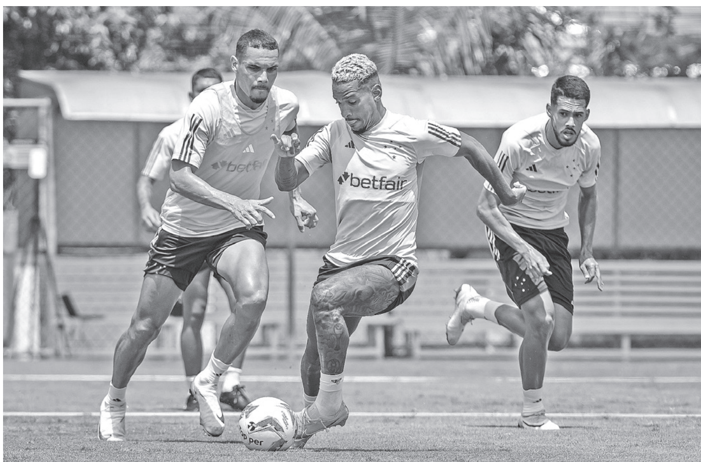
Jogadores do Cruzeiro já treinando para as disputas do Campeonato Mineiro desta temporada; jogo contra o Galo será no dia 3

O Palmeiras é o atual campeão da Supercopa do Brasil. Conquistou o título em fevereiro do ano passado ao ganhar do Flamengo por 4 a 3 no que foi um dos melhores jogos da temporada passada. O time alviverde foi vice em 2021. O São Paulo nunca ganhou a competição, refundada em 2020, depois de 29 anos de hiato.