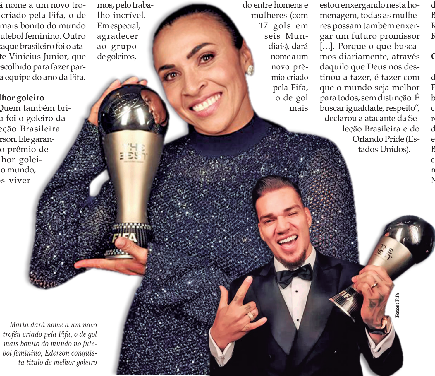
Marta dará nome a um novo troféu criado pela Fifa, o de gol mais bonito do mundo no futebol feminino; Ederson conquistou o título de melhor goleiro

A meio-campista Aitana Bonmatí, do Barcelona (Espanha), conquistou o prêmio após fazer uma grande Copa do Mundo na vitoriosa campanha da seleção da Espanha. Já a premiação de Messi, que atualmente defende o Inter Miami (Estados Unidos), causou certa surpresa. O argentino, que teve como maiores desafios esportivos no ano de 2023 os jogos da seleção argentina pelas Eliminatórias Sul-Americanas, deixou para trás na disputa o norueguês Erling Haaland, que conquistou a triplice coroa (Liga dos Campeões, Campeonato Inglês e Copa da Inglaterra) pelo Manchester City (Inglaterra), e o francês Kylian Mbappé, estrela em ascensão do PSG e da seleção de seu país.