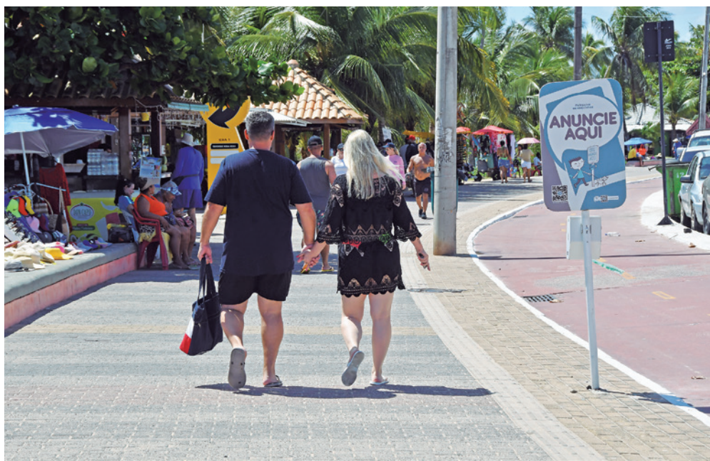
Capital paraibana tem atraído turistas interessados nas belezas naturais da cidade