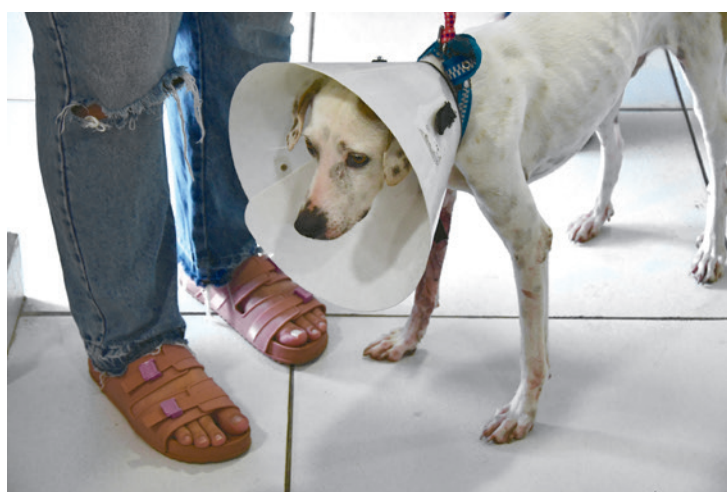
Cães devem ser levados na coleira e gatos, em caixa de transporte

No dia agendado para cirurgia, o tutor deve levar o cachorro na coleira e no caso de gatos, dentro de uma caixa de transporte. É orientado também que os tutores levem roupas cirúrgicas no caso de fêmeas ou colar elizabetano, que pode ser utilizado tanto para machos quanto para as fêmeas, coleira de identificação do animal e a carteira de vacinação do pet.