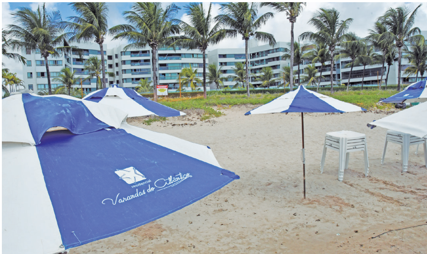
Condomínios residenciais estão ocupando irregularmente o espaço público destinado aos banhistas na areia da praia

Ainda de acordo com o promotor de Justiça, ficou acordado que o município intensificaria a fiscalização e realizaria operações para garantir o livre acesso das pessoas à praia, com segurança e sem a ocupação indevida desses espaços por bares e condomínios. Após receber os relatórios do município, a Promotoria de Justiça poderá tomar outras medidas que