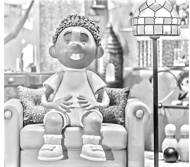
Curta 'Lé com cré' (SP), produzido na técnica 'stop motion'