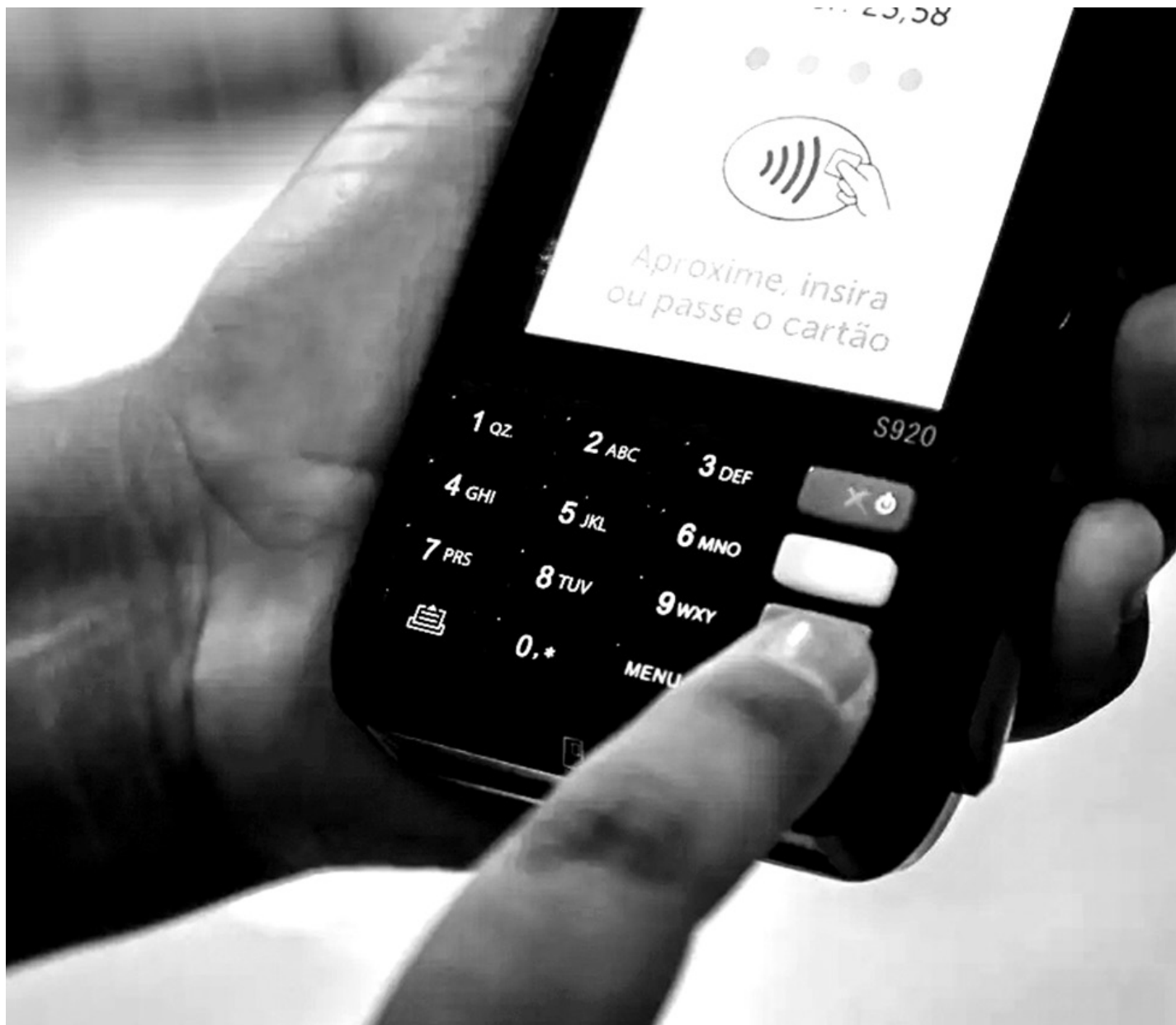
Senacon determinou que as empresas suspendam a oferta do que a Febraban classifica como “parcelado sem juros pirata”