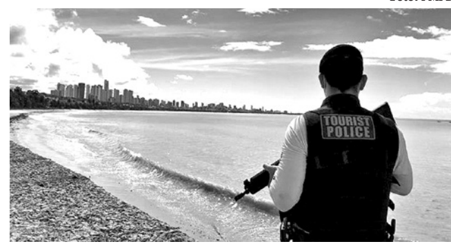
PM realiza a Operação Verão na orla de João Pessoa