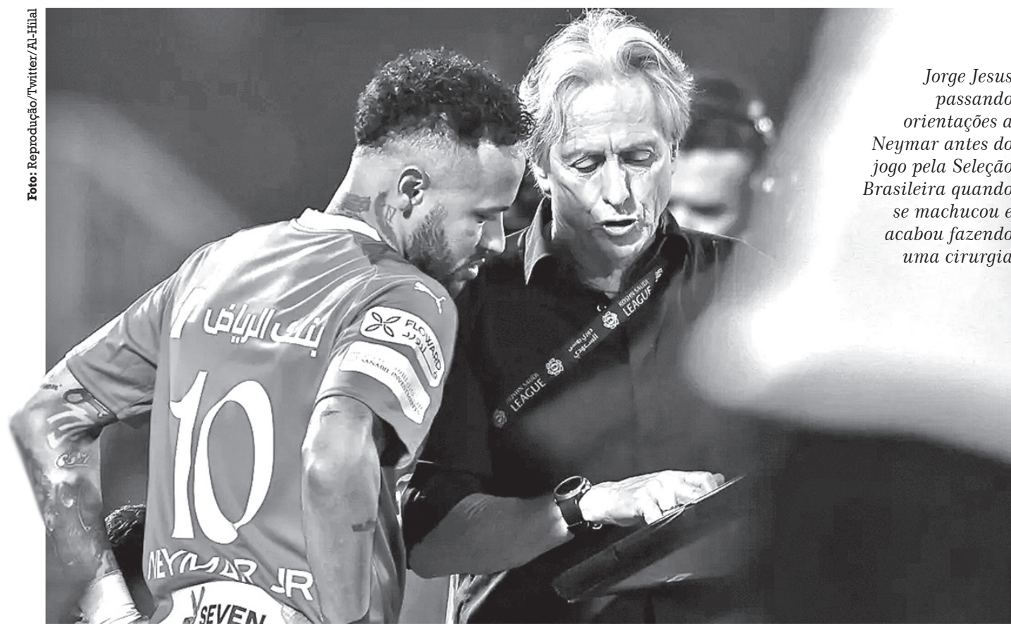
Jorge Jesus passando orientações a Neymar antes do jogo pela Seleção Brasileira quando se machucou e acabou fazendo uma cirurgia

O Brasil conquistou no último domingo (14) a primeira edição do Maranhão Cup International. A Amarelinha venceu os Emirados Árabes, por 3 a 1, e se sagrou campeão invicto da competição de Beach Soccer. O torneio reuniu as seleções principais dos Emirados Árabes, Marrocos e Estados Unidos em São Luís (MA). Antes, o Marrocos derrotou os Estados Unidos, por 4 a 1, e ficou com o vice-campeonato do torneio. Diante dos torcedores que lotaram a Arena Domingos Leal, na Lagoa da Jansen, o Brasil venceu com dois gols de Rodrigo, um deles de bicicleta, e Edson Hulk. Abdulla Abbas fez o único gol dos Emirados. Capitão e camisa 10 da Seleção, o ala Datinha comemorou a conquista do Maranhão Cup. “Estou muito feliz por estar representando a Seleção Brasileira em uma competição importante na capital do meu estado, é uma sensação única”, celebrou.